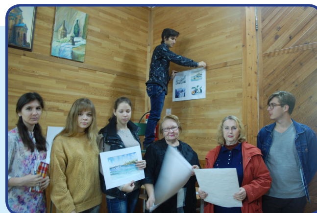
И так – от выставки к выставке, к новым достижениям.

Думаю, что лучшая моя работа, представленная на выставке, та, где изображена мельница, потому что удалось передать атмосферу. И ещё, работа гуашью. Мне приснились горы, и я попробовала нарисовать их в сочетании с реальным водопадом: проба трёх цветов – только синий, красный и белый.