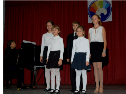
Автор: Дарья Ласкова