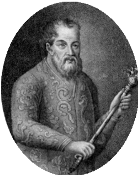
Князь Д.М. Пожарский. Боярин