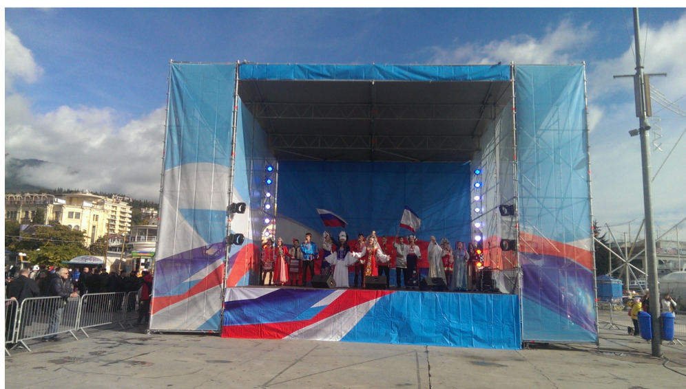
Вокальный ансамбль "AQUA VIVA" на главной сцене города Ялты на набережной