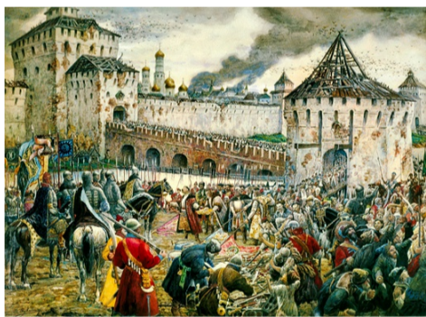
Изгнание поляков из Кремля. Художник Э. Лиснер

День народного единства - это особый день в нашей истории. Это символ сплочения, единения всех народов. Если мы едины, мы непобедимы! Впервые этот праздник стали отмечать в 2005 году. Первое празднование развернулось в Нижнем Новгороде. Именно там открывали памятник К. М. Минину и Д. И. Пожарскому - лидерам народного ополчения, которые в 1612 году к Москве несли икону Казанской Божией Матери и штурмом 2 ноября взяли Китай-Город, а 24 ноября поляки ушли из Москвы. Это было сложное время - время смуты и благодаря сплочению всего народа разных национальностей, разных сословий мы смогли победить тогда в 1612 году и закончилась смута, началось возрождение Российского государства в 1613 году. Был избран царь из дома Романовых - Михаил. Его сын Алексей Михайлович постановил отмечать 4 ноября, как дань благодарности Казанской Божией Матери, как дань освобождения Москвы от поляков.