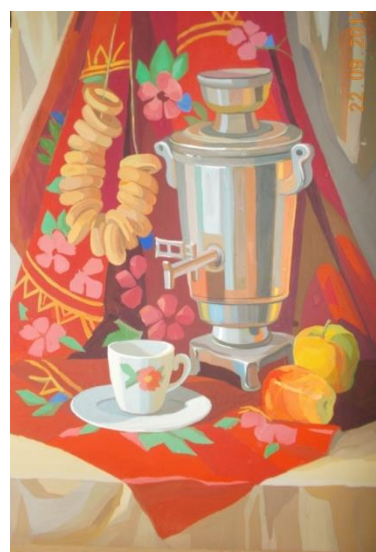
Рис.2,3 Декоративный натюрморт с натуры