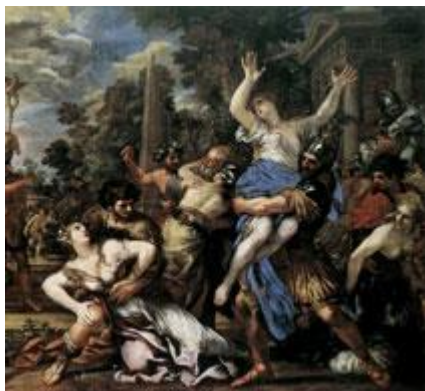
Пьетро да Кортоне Похищение сабинянок

работать многие художники, сохранявшие в своем творчестве традиции реализма. Среди них выделяется особой эмоциональной насыщенностью и своеобразием богатого сдержанного колорита искусство болонского художника Джузеппе Мария Креспи (1664—1747), пролагающего пути развития реализма последующего периода.