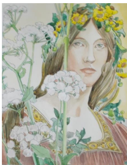
Рис.8,9 Декоративный портрет