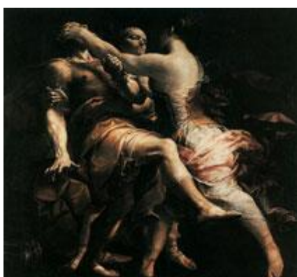
Креспи. Гекуба и Полимнестор