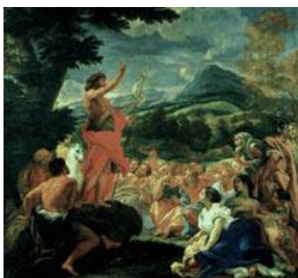
Гаулли. Проповедь Иоанна Крестителя