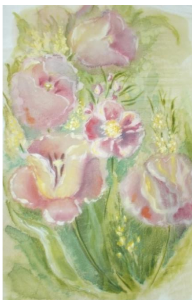
Рис1,2 Декоративные натюрморты