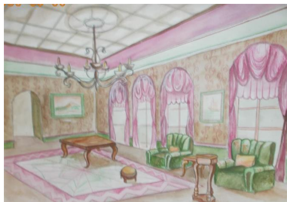
Рис.4,5 Декоративный интерьер