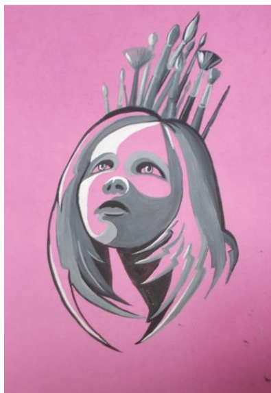
Рис.6,7 Автопортрет декоративный