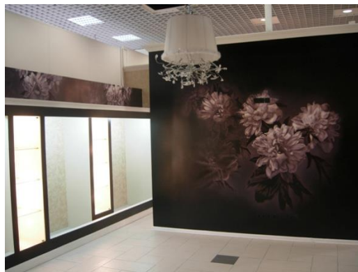
Рис.7,8. Цветы в росписи интерьера