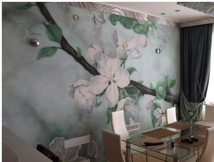
Рис.1,2. Угловая и фасадная роспись стены