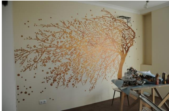
Рис.3,4. Роспись интерьера в технике «гризайль»