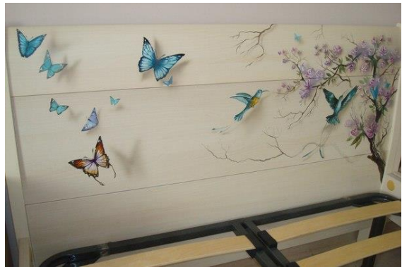
Рис.5,6. Объемная роспись в интерьере