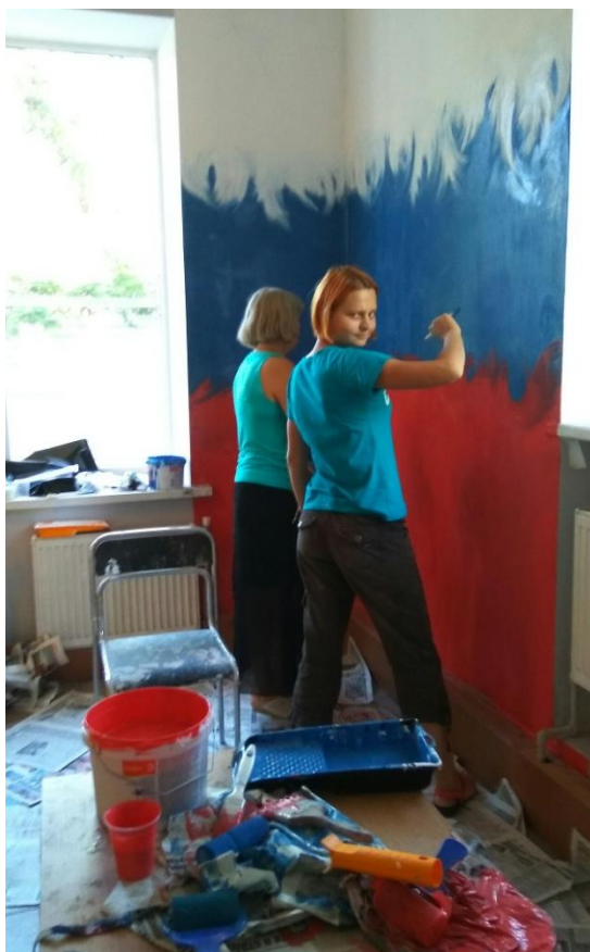
Рис.10 Роспись стены в Совете ветеранов