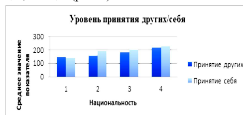
Рис. 2. Уровень показателей «принятия других и себя» как фактор формирования личностной идентификации.

коренные народы севера и наименее принимающие себя – представители русских, украинцев, немцев (рис. 2).