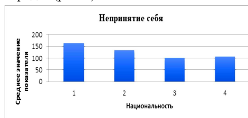
Рис. 3. Уровень «непринятия себя» как фактор формирования личностной идентификации.

Отличие прослеживается и по показателю неприятия себя. Наиболее непринимаящие себя – представители русских, украинцев, немцев; далее – представители малых коренных народов севера, затем – представители кавказских народов, и наименее непринимаящие себя – представители тюркских народов (рис. 3).