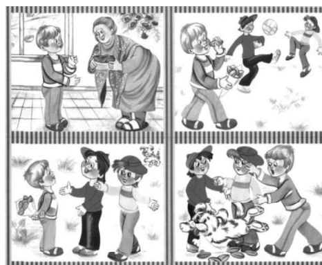
Рис. 2. Серия картинок «Жадность»

Представленная серия картинок «Обман» (рис. 1). После рассказа ребенку задавали вопросы, чтобы проверить степень коммуникативной сформированности: Что скажет девочка продавцу, когда подойдет? Как она закончит разговор? Нужно ли помогать маме? Почему? Какой разговор произошел между мамой и дочкой?