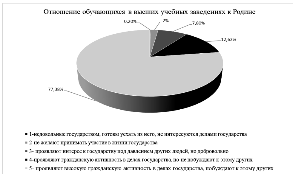
Рис. 1. Отношение студентов педагогического университета к Родине