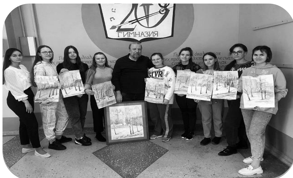
Рис. 6. Творческие каникулы в рамках деятельности базовой кафедры педагогических технологий МГПУ им. М. Е. Евсевьева