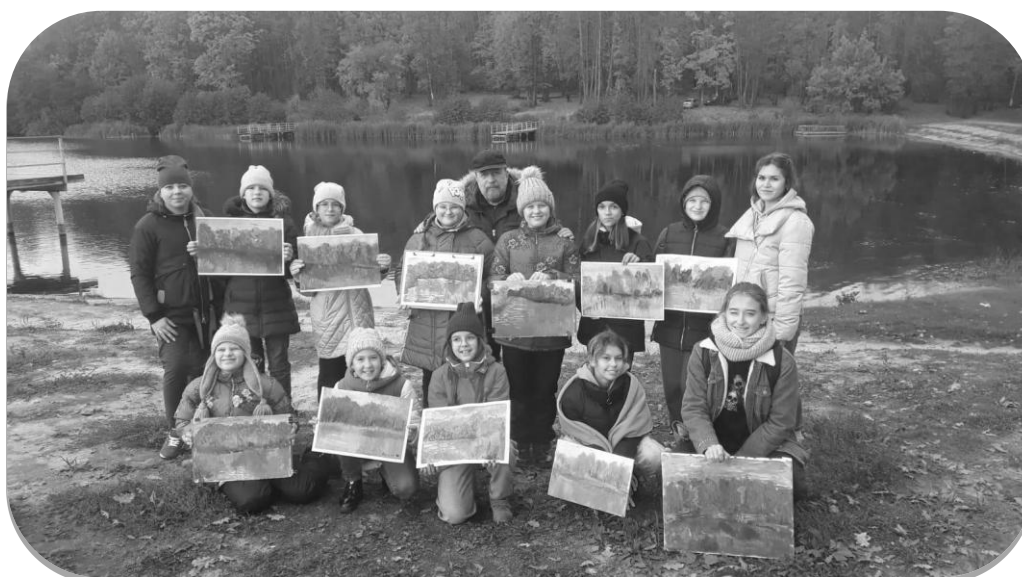
Рис. 4. Организация производственных практик – пленэр «Родные просторы»