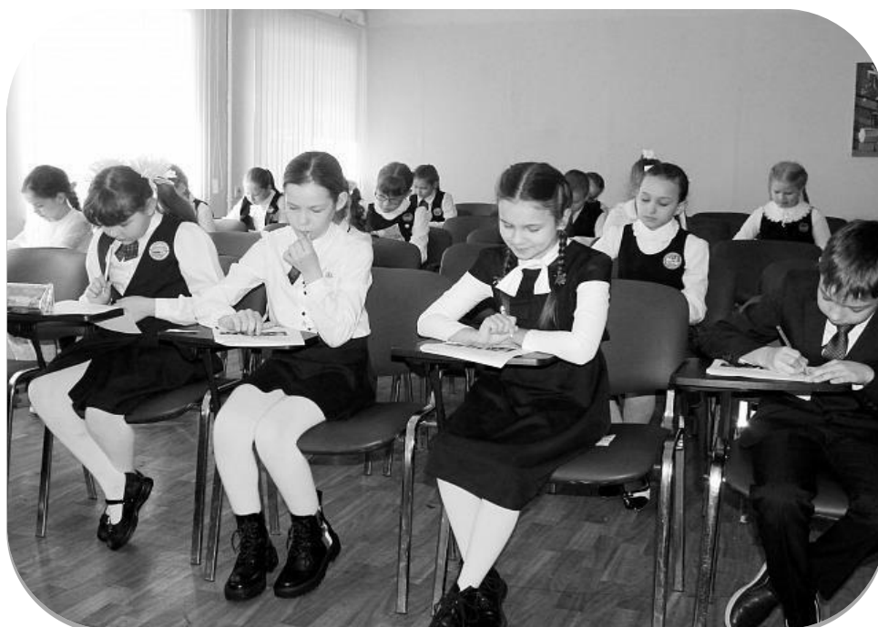
Рис. 5. Республиканская олимпиада по музыке для обучающихся 3–4 и 6–8 классов