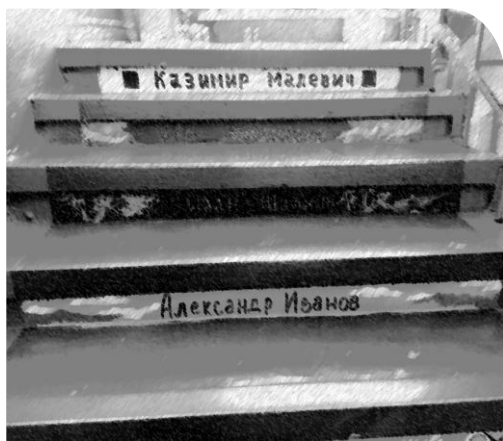
Рис. 1. Проект «Создание на базе гимназии № 20 им. В. Б. Миронова Малой Школьной Академии изящных искусств»

педагогических технологий активно осуществляется работа в социокультурном, профориентационном и воспитательном сопровождении. Ежегодно проводятся музыкальные салоны как одна из форм творческих встреч для обобщения педагогического опыта школ и вуза. В 2021 г. на кафедре художественного и музыкального образования был проведен Музыкальный салон «Детский мир в музыке С. С. Прокофьева» (рис. 2). В мероприятии приняли участие обучающиеся и преподаватели гимназии № 20 и детской музыкальной школы № 1 г. Саранска, студенты и преподаватели факультета педагогического и художественного образования. Участники встречи вспомнили интересные моменты творчества композитора и рассмотрели проблемные вопросы, связанные с музыкальным воспитанием в контексте отечественной исполнительской культуры, ее традиций и богатейшего потенциала композиторского наследия.