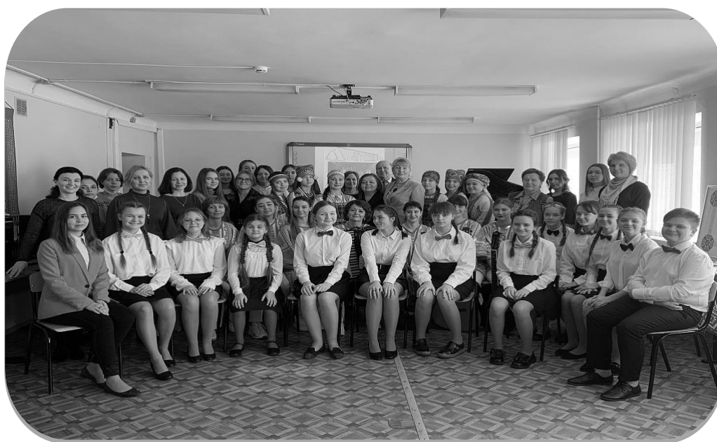
Рис. 3. Музыкальный салон «Пою мое Отечество – Мордовию пою»