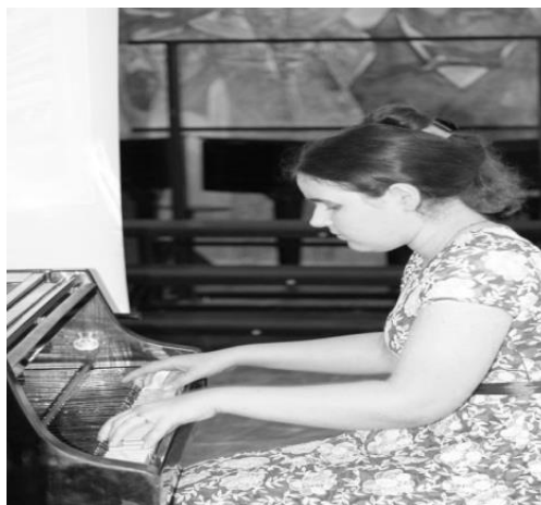
Рис. 2. Музыкальный салон «Детский мир в музыке С. С. Прокофьева»