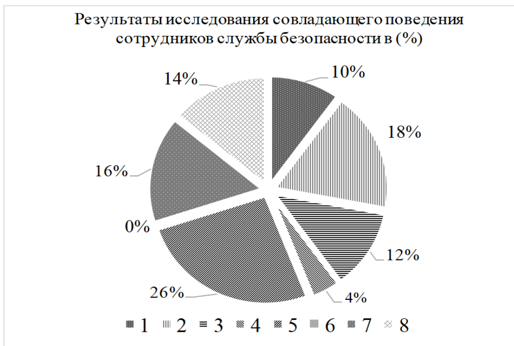
Рис. 2. Результаты исследования способов совладающего поведения у сотрудников службы безопасности отелей Крыма в (%)

По фактор MD «адекватная самооценка – неадекватная самооценка»: у 66 % испытуемых была выявлена адекватная самооценка, что позволяет говорить о том, что они адекватно воспринимают себя, свои положительные и отрицательные стороны. Неадекватная самооценка выражена у 34 % испытуемых, что говорит о том, что они недовольны и неуверенны в себе и своих силах.