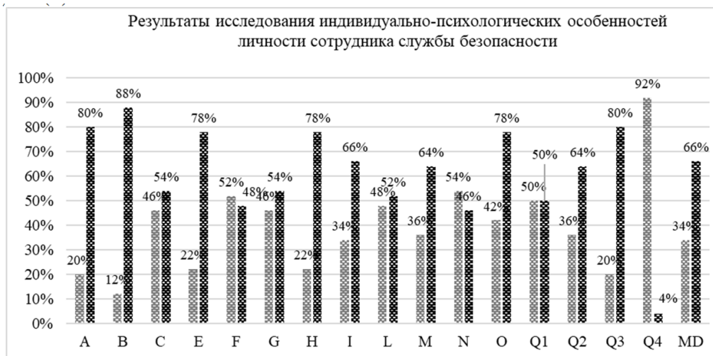
Рис. 1. Результаты исследования индивидуально-психологических особенностей личности сотрудников службы безопасности отелей Крыма

Базой исследования выступили отели Республики Крым (Бухта Мечты; Ялта-Интурист; Palmira Palace Resort & Spa). Выборку испытуемых составили сотрудники службы безопасности в количестве 50 мужчин в возрасте от 27 до 45 лет.