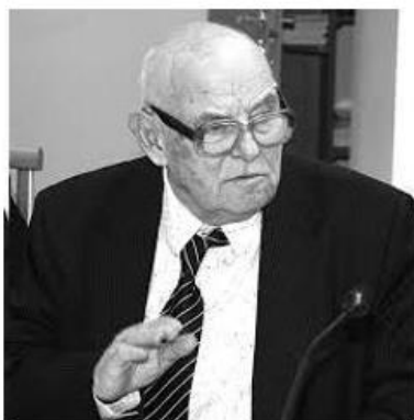
Дмитрий Сергеевич Чернавский (1926–2016)

музыкального произведения на человека формируют процесс самосовершенствования, который носит системный характер, представляя собой множество взаимодействующих процессов, образующих определенную структуру, предназначенную для осознанного, целенаправленного, активного развития эмоционального интеллекта человека. Понятие эмоционального интеллекта появилось в конце XX века и обозначает способность воспринимать и генерировать эмоции, содействуя мышлению, понимать смысл эмоций и управлять ими, помогая эмоциональному и интеллектуальному росту. [4]. Эмоциональное воздействие заложенных в музыкальном произведении духовных, нравственных, интеллектуальных пластов становится катализатором многих процессов внутри человека. Для прогнозирования силы и направленности нужно учитывать множество факторов сложного синергетического явления, таких как качество исполнения, подготовленность, физическое и эмоциональное состояние слушателя. Динамическая теория информации, представленная профессором Дмитрием Сергеевичем Чернавским на рубеже веков, предлагает анализ процесса творчества.[5]