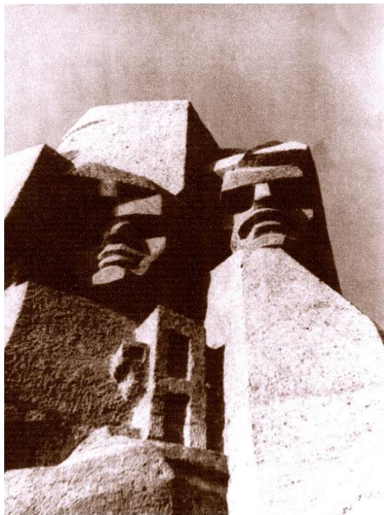
Рис. 1,2. Монумент погибшим партизанам и землякам в селе Партизанском, Симферопольского района Республики Крым.

На всех континентах имеется огромное количество мемориальных инициатив низовых организаций и организаций гражданского общества, которые могут дополнять описание событий прошлого в трактовке официальной историографии, быть реакцией на них или даже полностью им противоречить.