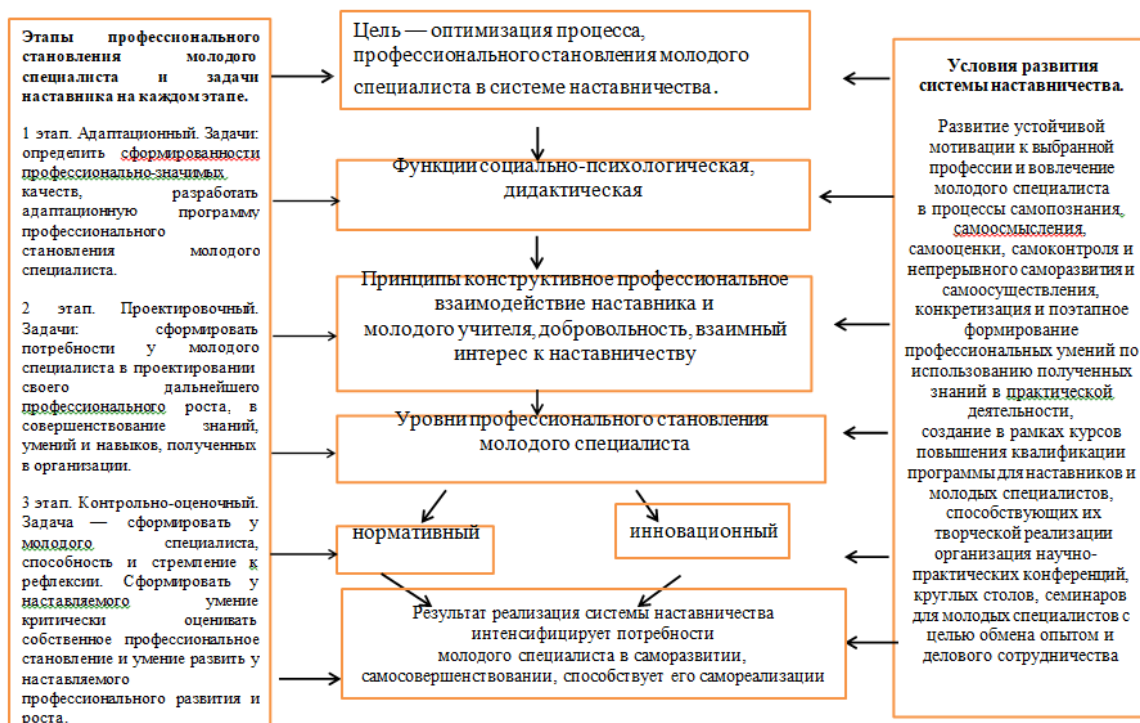
Рисунок 1. Структурно- функциональная прогностическая модель системы наставничества, обеспечивающая профессиональное становление молодого специалиста

Приведём пример структурно-функциональной прогностической модели системы наставничества, которая обеспечивает профессиональное становление молодого специалиста (см. рис. 1).