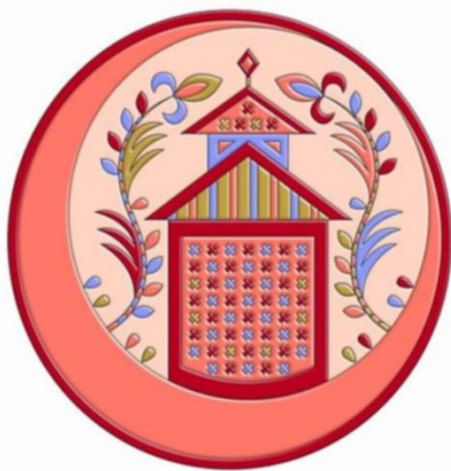
Рис. 1 Орнамент «Мечеть»

Красный цвет имеет особое значение в крымско-татарском прикладном искусстве. Он символизирует силу, энергию и страсть. Красный цвет часто используется в орнаментах и узорах на текстиле и керамике (Рис. 1).