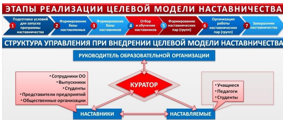
Рис. 2. Этапы реализации целевой модели наставничества.

Рассмотрим особенности наставничества. Самое главное в данном направлении: атмосфера доброжелательности, молодой коллектив, желание наставника передать ЗУНы. Одной из самых актуальных, с нашей точки зрения, является линейно-функциональная структура управления наставничеством (см. рис. 3).