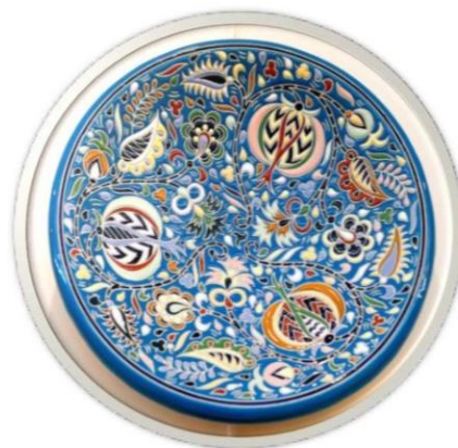
Рис. 2 Крымско-Татарская керамика

Синий цвет также имеет свою символику в крымско-татарском прикладном искусстве. Он ассоциируется с небом и водой, символизирует гармонию и спокойствие. Синий цвет часто используется в орнаментах на керамике и текстиле (Рис. 2).