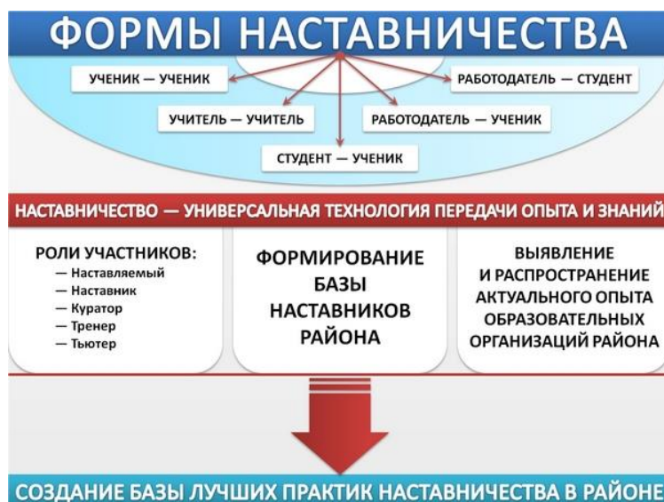
Рис. 4. Формы наставничества.

В рамках образовательной деятельности профессиональной образовательной организации предусматриваются (независимо от форм наставничества) две основные роли: наставляемый и наставник (см. также рис. 4).